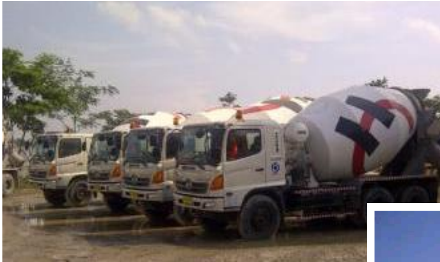
10 Unit Truk Mixer

Batching Plan HOLCIM Mranggen, Semarang – Jawa Tengah